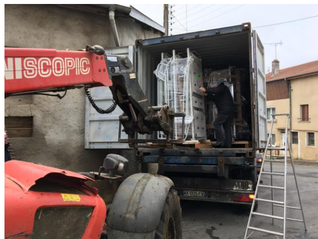
Container de matériel médical VERSO pour le Sénégal