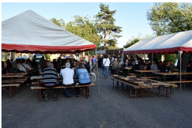
Feu de la Saint Jean 2016