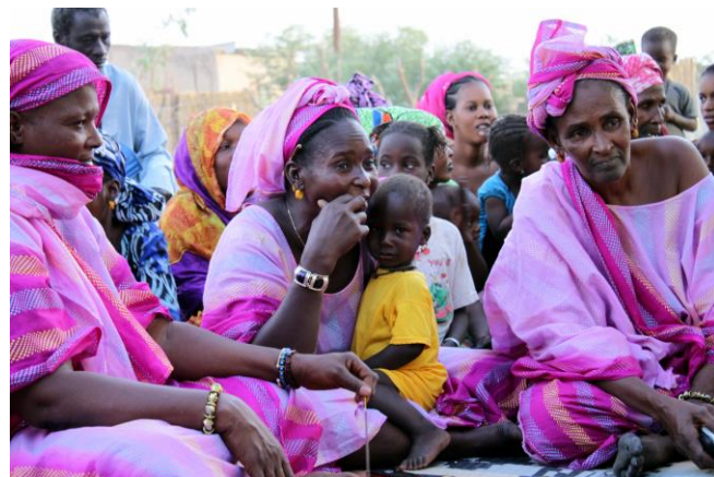
Cérémonie après réception des travaux de la case de santé

Une équipe de 6 bénévoles de VERSO (Voyages Echanges et Rencontres Solidaires) dont 2 habitants d'Autreville se sont rendus au Sénégal début janvier. Au programme de leur mission, outre le plaisir du voyage, était prévu la concrétisation de plusieurs projets.