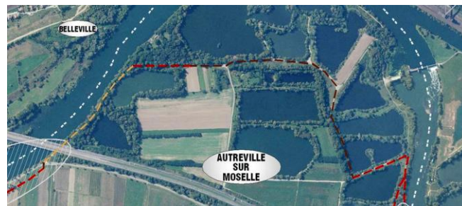
Tracé de la véloroute sur le site des étangs

tracé empruntera la RD40 dans la traversée de la commune sans aménagement particulier. Il rejoindra alors le site des étangs en passant sous le viaduc (voir le dessin), longera les petits étangs communaux avant de rejoindre Dieulouard grâce à un aménagement le long du talus de l'autoroute sur le bras mort de la Moselle. Les travaux réalisés prévoient l'usage par tous de ce site et les étangs resteront accessibles aux pêcheurs. Au final, cet aménagement permettra la promenade en vélo bien sûr mais également en rollers ou à pieds !