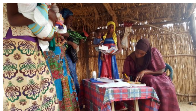
Consultation de dépistage de la malnutrition