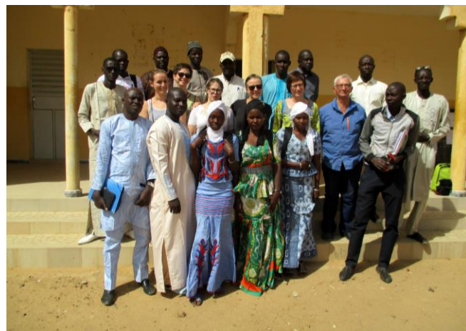
Avec les professeurs et des élèves du lycée

La réception d'une case de santé, la mise en route d'un projet « Espace Ados – prévention des grossesses précoces, des MST, du SIDA », le suivi de l'école maternelle communautaire, un stage de formation de 77 enseignants, une seconde formation numérique au lycée de Gaé, le soutien par VERSO d'un programme de dépistage de la malnutrition, ... ont constitué l'essentiel de la mission.