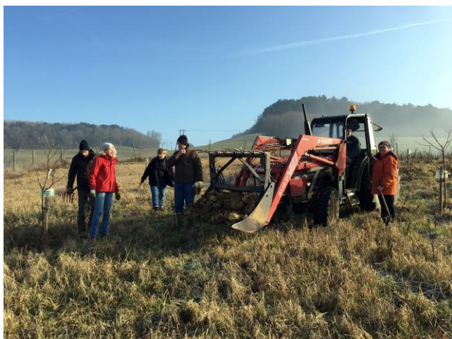
Reprise des activités sur le verger pédagogique