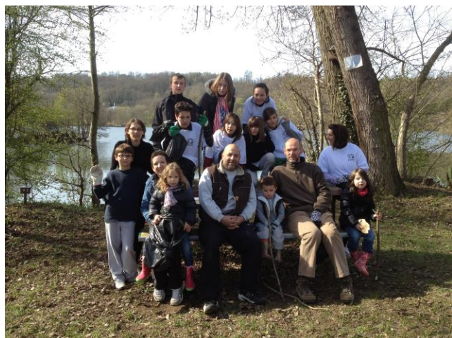
Nettoyage de printemps 2012. Les petits ont grandi !

Le grand nettoyage de printemps des bords de Moselle et de nos étangs aura lieu cette année le dimanche 9 avril . Ce projet soutenu par Familles Rurales, les associations, le PEL et les communes permettra à tous, petits et grands, de passer un bon moment ensemble dans l'intérêt de la nature et de notre environnement. Rendez-vous sera donné comme chaque année dans la salle AFR de Millery à 9h00 pour démarrer la matinée par un café brioche ou directement sur le site des étangs. Un repas tiré du sac pourra ensuite être partagé à Ville-au-Val. La nature compte sur vous ! Ce ramassage de printemps sera au cœur d'une quinzaine de l'environnement organisée par le PEL et la CCBPAM. Plus d'informations prochainement dans les boites aux lettres.