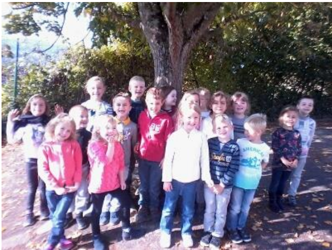
La classe de Grande section et CP