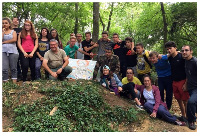
Chantier jeunes international de Champey avec le PEL