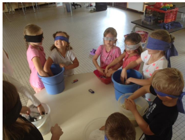
Etape à « La Rochelle » : grand jeu Fort Boyard