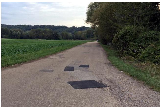
65 m 2 de nids de poules réparés sur les chemins des étangs

Pendant l'été et en ce début d'automne, plusieurs travaux de voirie étaient nécessaires. La société SVT a entrepris de boucher les nids de poules sur les chemins des étangs ou dans le village. L'entreprise FERREIRA quant à elle a réparé le mur en pierres sèches qui soutenait un sentier communal et qui s'était effondré sur une longueur de 5 mètres. La société P2E a exécuté la fauche et l'élagage des arbres autour des étangs et le long de la rue du Sorbier. Le coût total de ces travaux s'est élevé à 13 850 €.