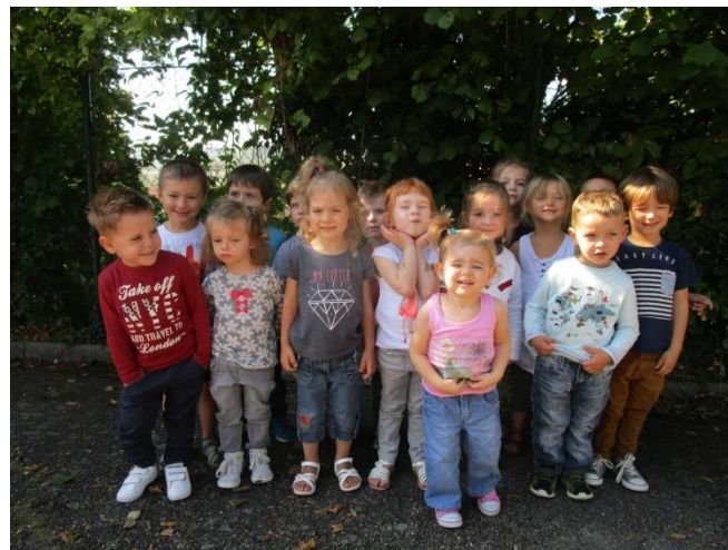
La classe des petits et moyens

La Médiathèque de Dieulouard nous accueillera le jeudi 17 Novembre (TPS/PS/MS) et le jeudi 24 novembre (GS/CP). Les TPS/PS/MS seront accueillis par une animatrice qui leur contera une histoire tandis que les GS/CP découvriront le Kamishibaï, théâtre japonais qui raconte une histoire par le biais de grandes planches illustrées.