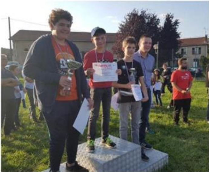
Le podium des enfants.

Pour cette première édition de course de tacots, plus communément connu sous le nom de caisse à savon, on peut considérer que c'est une véritable réussite.