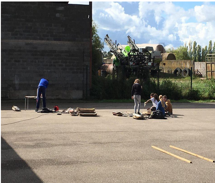
Préparation du wall of skate Ponçage des planches de skates.

Accueillis par la commune de Loisy, 6 jeunes de 11 à 20 ans ont participé à la construction du Wall of Skate : mur géant composé de 99 planches de skates qui a été utilisé comme mur de graff. Les jeunes ont profité de cette journée pour confectionner des panneaux de signalisation.