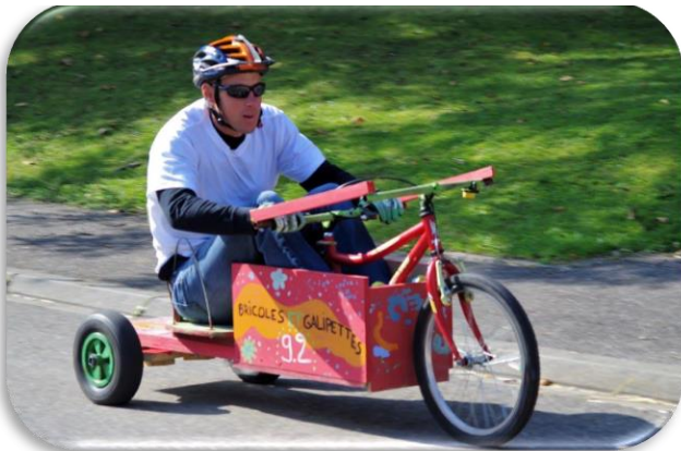
Autreville-sur-Moselle « Bricoles et Galipettes »