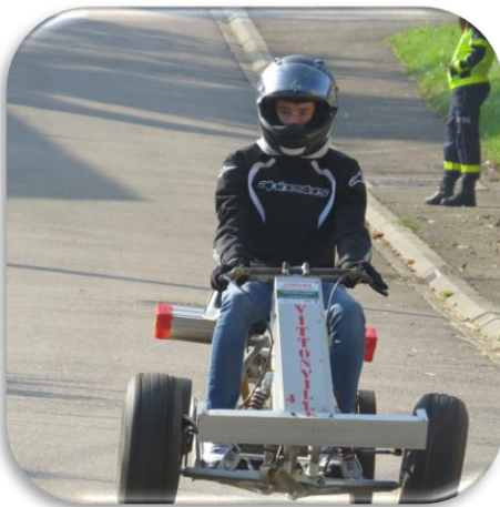
« Equipe Vittonville »