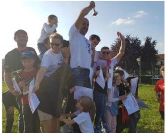
Le podium des adultes.

Les plus petits ont pu tester des engins à roulette de toutes sortes. Quant à la buvette, elle a vidé les frigos, car le beau temps de ce dimanche a donné faim et surtout soif.