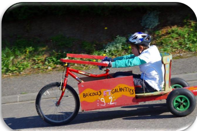
Autreville sur Moselle « Bricoles et Galipettes »