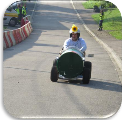
Bouxières-sous-Froidmont « Buxus 1 »