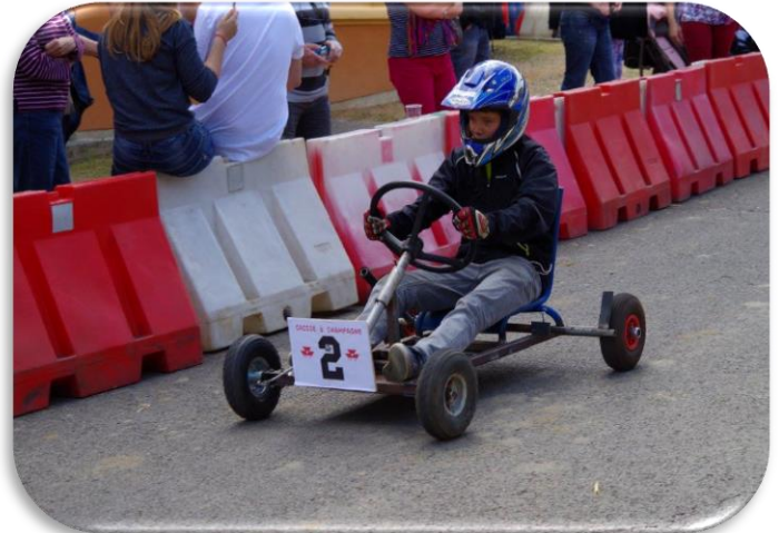
Morville-sur-Seille « Caisse à Champagne »