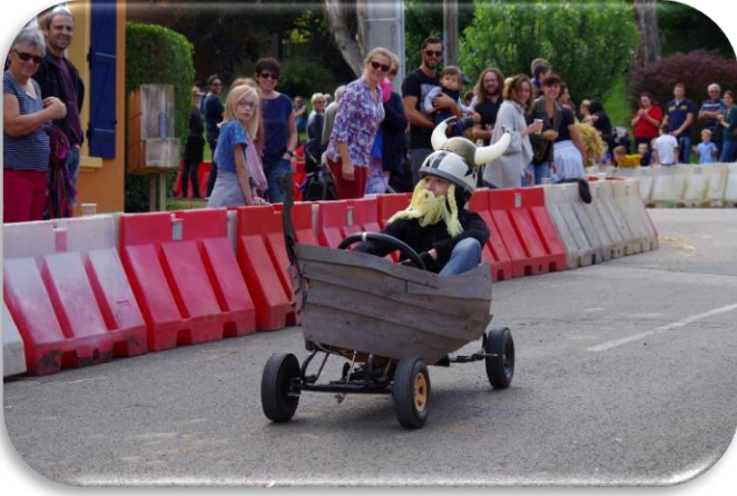
Autreville-sur-Moselle « Les Raisins »